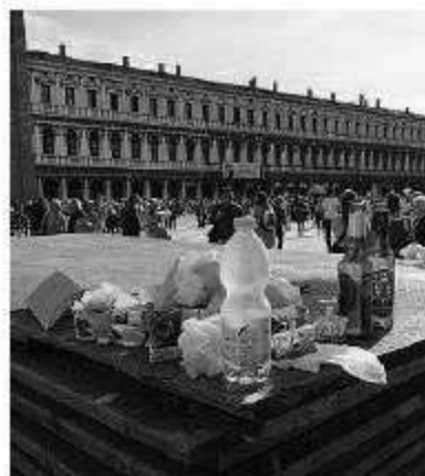
Ciò che resta dopo il passaggio dei turisti mordi e fuggi

e Bed and breakfast, se ne vanno i residenti. Chiudono negozi e artigiani storici, abbigliamento e ferramenta. L'invasione lascia segni evidenti sul terreno. Rifiuti ed escrementi in calle, cartacce e bottigliette. Trenta milioni di persone che non trovano informazioni e servizi.