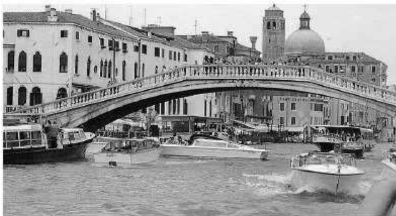
La concentrazione di vaporetti e motoscafi in Canal Grande

I taxi corrono ovunque, il moto ondoso non interessa più a nessuno, i vaporetti sono stracarichi di turisti. Nessuno parla più di diversificare i flussi, né di ridurre il numero delle persone che arrivano a Venezia incoraggiati dalle offerte speciali delle Ferrovie. Card, incentivi e districenti, Zil, tariffe diversificate e obbligo di prenotazione. Tutto nei cassetti, compresa la pianificazione. La realtà, che supera la fantasia, è un corteo infinito di gente che arriva la mattina e se ne va dopo poche ore. Non porta ricchezza ma disagi, aumenta i costi per i residenti. Risultato è che si moltiplicano sedie e tavolini, plateatici anche sotto le chiese e sulle barche, bar, gelaterie e negozi di oggetti made in China, spariscono i locali storici e gli artigiani. Si moltiplicano affittacamere, appartamenti a uso turistico