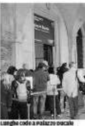
Lunghe code a palazzo Ducale

I Musei Civici tengono grazie al Ducale, circuito delle chiese in crisi, bene Biennale e Guggenheim