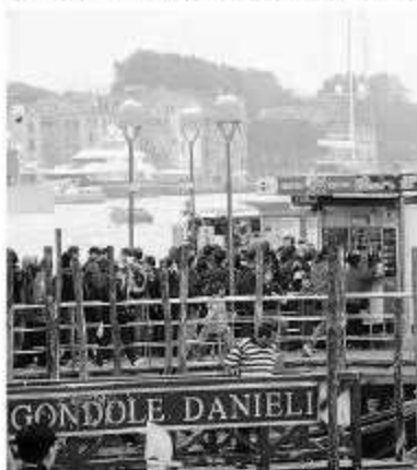
L'assalto ai pontili per un posto sul vaporetto